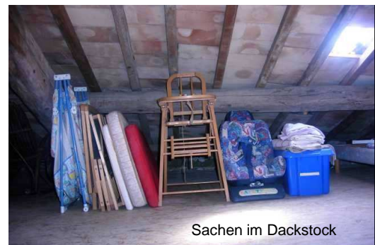
Sachen im Dachstock

Im Estrich hat es auch sonst noch einiges, was wir als "privat" betrachten. Bitte sich nur von den Sachen bedienen, die wir in diesem Ordner beschreiben. Danke für Ihr Verständnis.