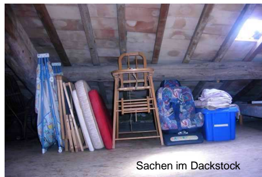
Sachen im Dachstock

Im Estrich hat es auch sonst noch einiges, was wir als "privat" betrachten. Bitte sich nur von den Sachen bedienen, die wir in diesem Ordner beschreiben. Danke für Ihr Verständnis.